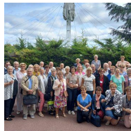
Les délégués Nationaux