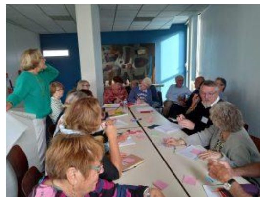
Groupe de Travail sur la relève des UR

À vos agendas : Une AGE et le prochain CA de l'IdF se tiendront à la Mairie du 9 ème à Paris le jeudi 6 février.